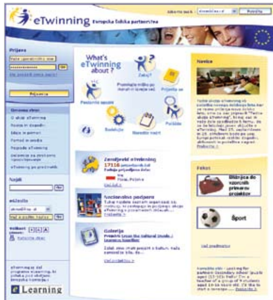
Spletna stran eTwinning.

Tudi v šolskem letu 2006/2007 slovenska nacionalna svetovalna služba za akcijo eTwinning sofinancira udeležbo na pedagoških delavnicah. Delavnice potekajo v več evropskih državah. Več informacij o samih delavnicah in postopku za pridobitev dotacije najdete na spletni strani www.cmepius.si , o podrobnostih pa se lahko pozanimate tudi prek elektronskega naslova elearning@cmepius.si .