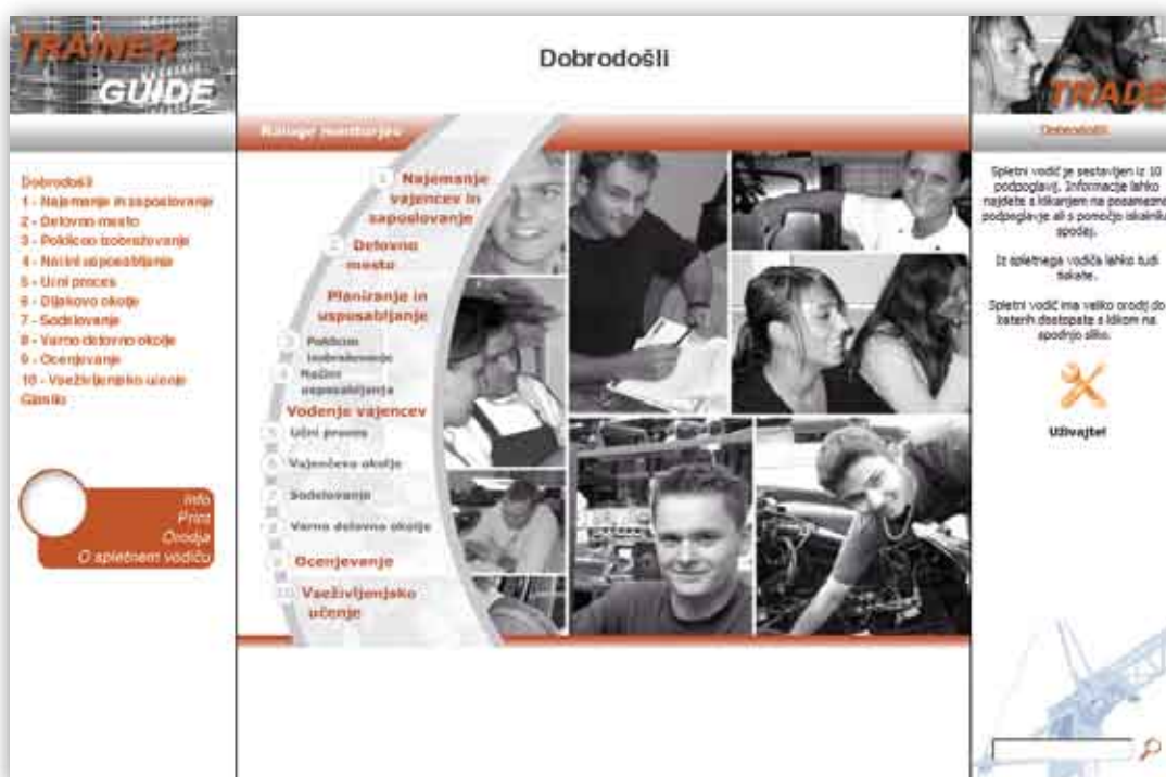
Spletna stran slovenskega vodiča www.trainerguide.si

Spletni vodič za mentorje v delovnem procesu je nastal leta 2010 v mednarodnem projektu v okviru podprograma Leonardo da Vinci. Sodelujoči partnerji smo najprej postavili skupni evropski spletni vodič. Zaradi različnosti partnerjev, zakonodaje ter urejenosti tega področja po posameznih državah smo se odločili, da pripravimo tudi nacionalne spletne vodiče. Vse spletne vodiče partnerskih držav, Danske, Nemčije, Nizozemske, Finske, Turčije in Slovenije, najdete na spletni strani http://www.trainerguide.eu