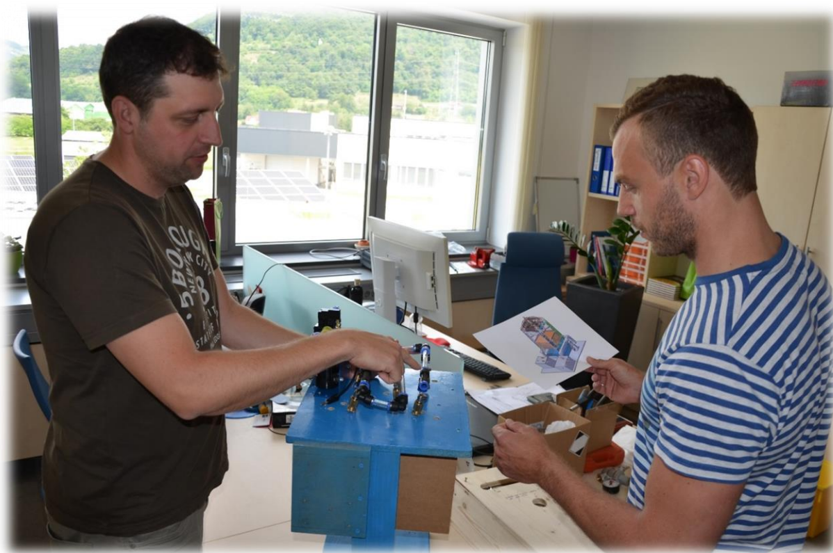
Učitelj Srednje poklicne in strokovne šole Krško, ki se usposablja v okviru programa DPKU v podjetju GEN energija, d.o.o.

»Učitelji preko tega pridejo v stik z realnim delovnim okoljem, z novostmi v procesih dela in tehnologijah. Lahko bi rekli, da gre za neke vrste praktično usposabljanje učiteljev na delovnem mestu. Z njim le-ti obogatijo svoje znanje in izkušnje, ki jih nadalje predajajo tudi svojim dijakom. Nivo in širina znanja dijakov se tako viša in s takim znanjem prihajajo tudi k delodajalcem na obvezno prakso, študentsko delo ali končno zaposlitev.«